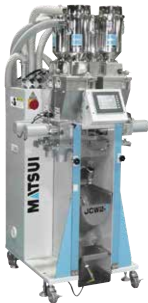
[ JCW2 - i - 05 ]

マツイが開発したセルフコントロール機能を持つ智能化された配合装置です。樹脂の使用量を自ら判断し、必要最小限の配合バッチ量に自動的に最適化、混ぜ残りを最小限におさえます。