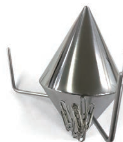
[マグネットタイプ]