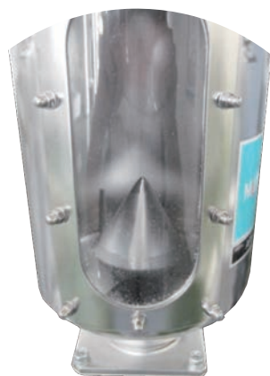
ホッパー内に設置