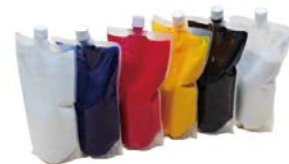
リキッドカラー パウチ