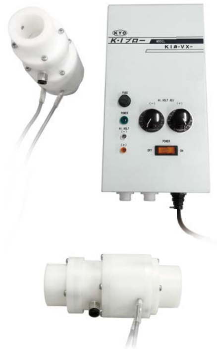
[ KI-2000-ATC-38 ]