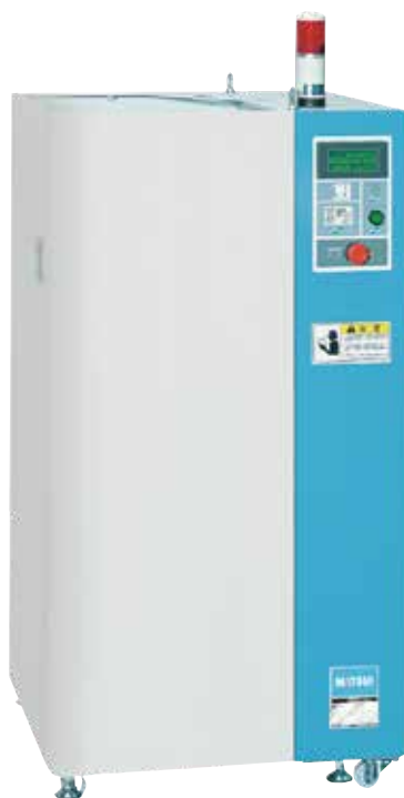
[ DPD3.1 ]

真空による乾燥では、ペレットの加熱のために熱風を当てる必要がなく、水分を外部に出すための最小限のパーリエアーを使うのみです。このことによりコンタミのリスクを低減することができます。また真空下で乾燥させるため、材料によっては、酸化・黄変を防止し、黒点異物を減少させる効果もあります。